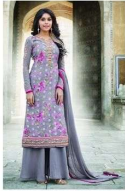
D.NO. :- 992