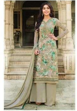
D.NO. :- 994