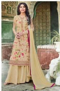
D.NO. :- 996