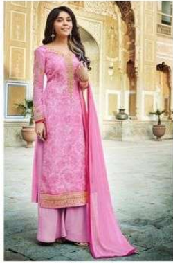
D.NO. :- 991