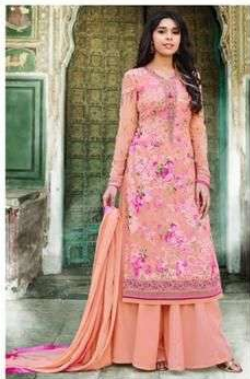
D.NO. :- 995