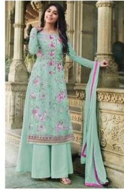
D.NO. :- 993