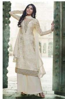
D.NO. :- 997